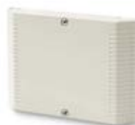
MultiCon Dveřní SLAVE modul