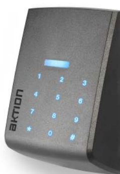
Bezkontaktní s PIN