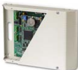
MultiCon Řídící MASTER kontrolér